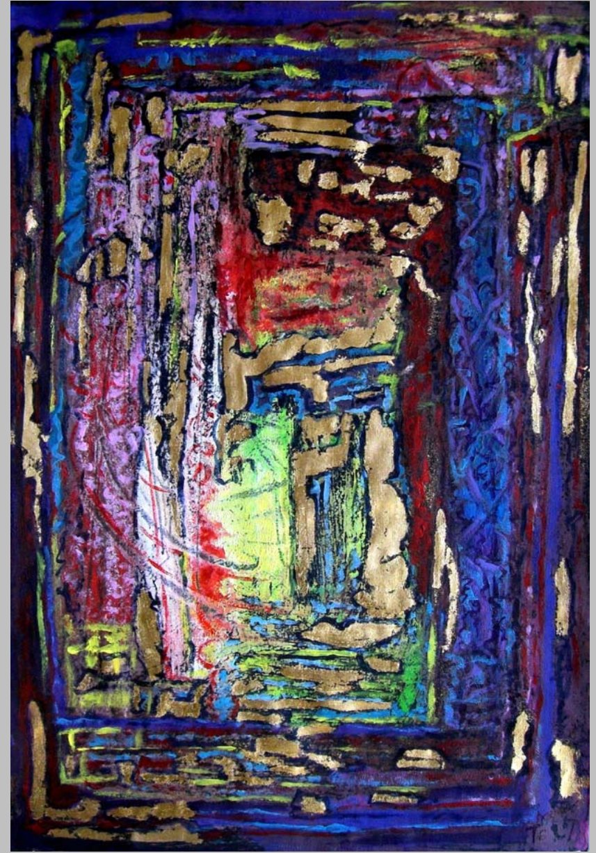
Transit 6, goldleaf acryl on paper, 60 x 40 cm, 2010