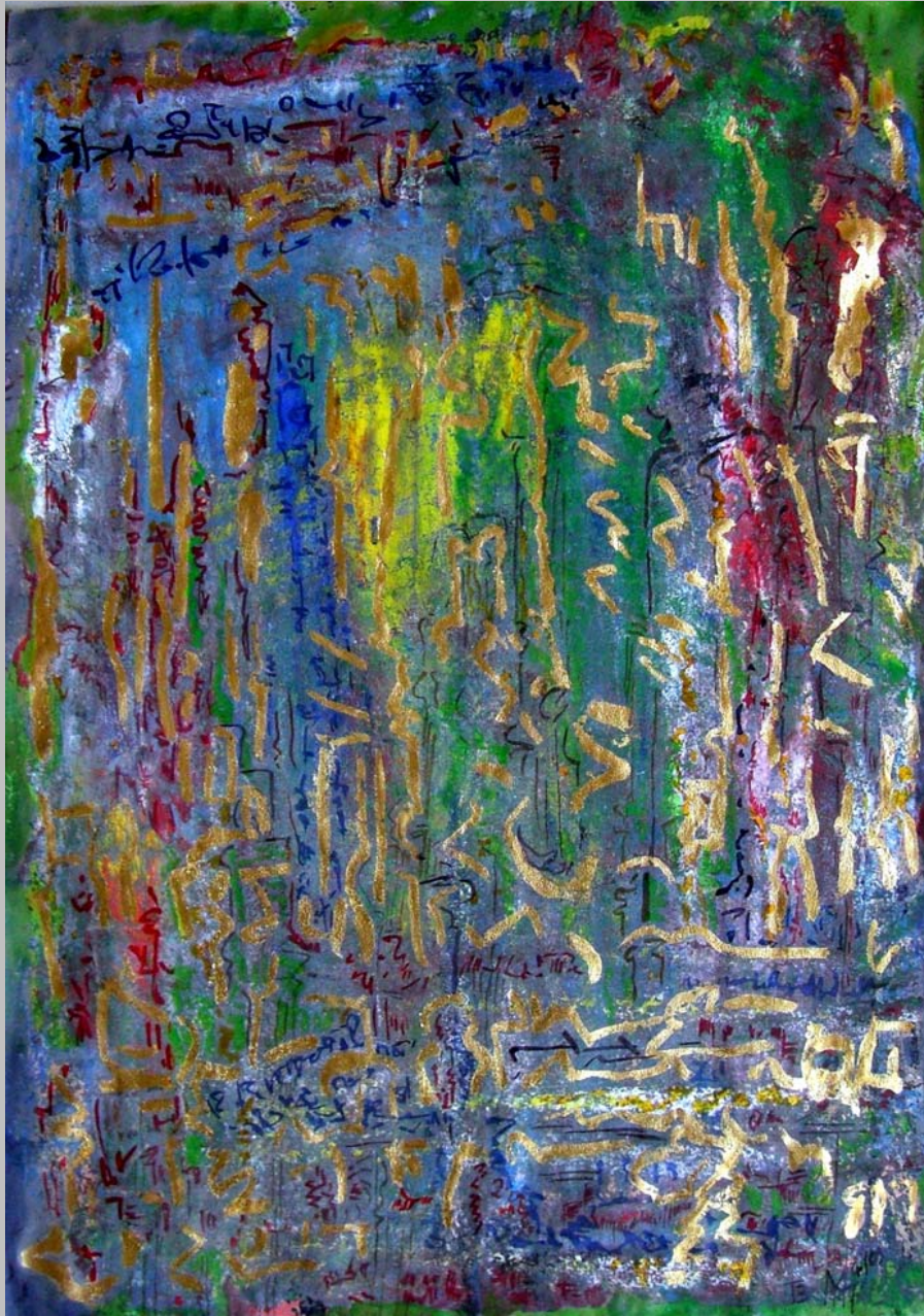
Transit 3 goldleaf gouache acryl on paper, 50 x 35 cm, 2010