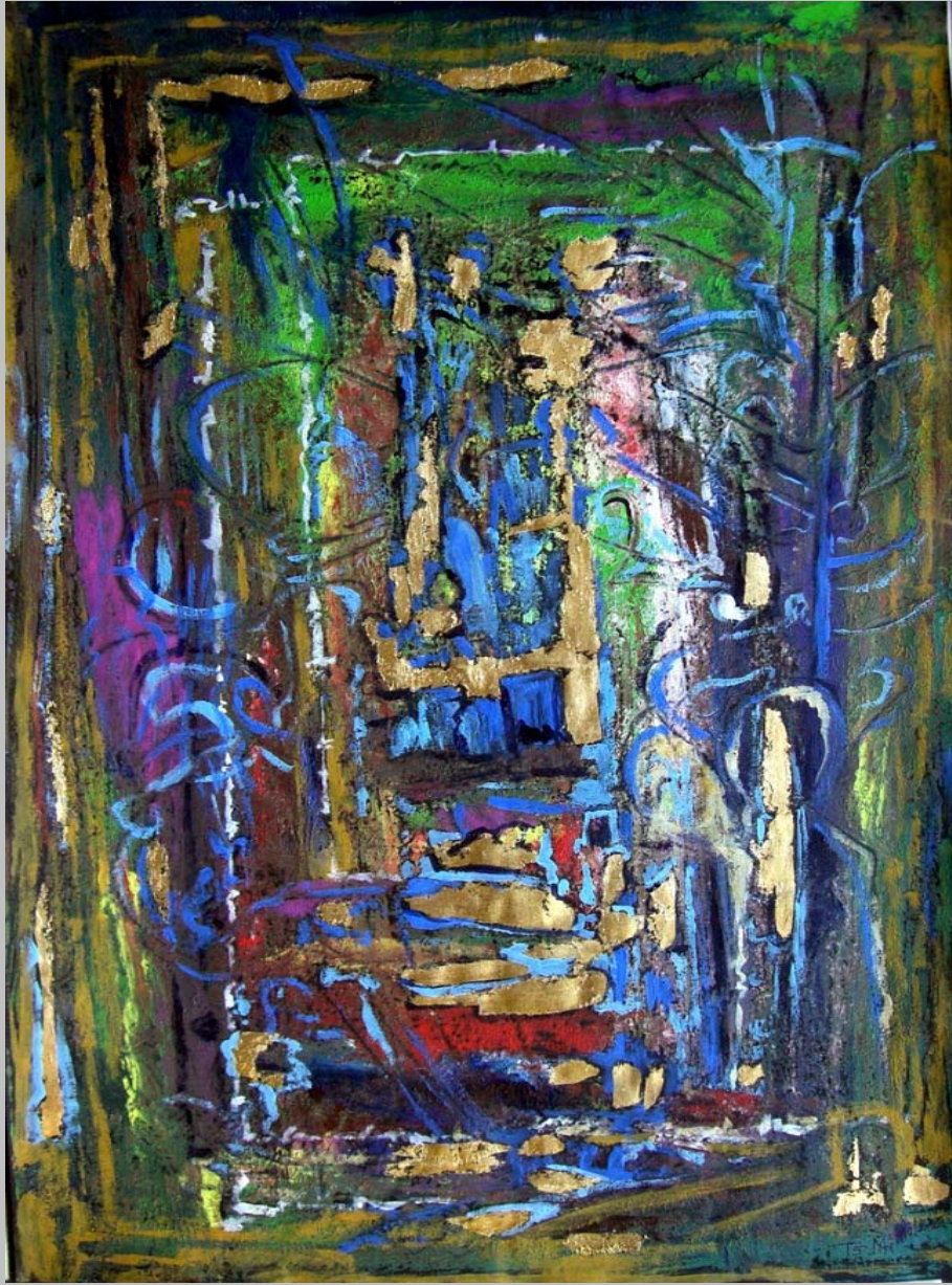
Transit 5, goldleaf acryl on paper, 60 x 40 cm, 2010