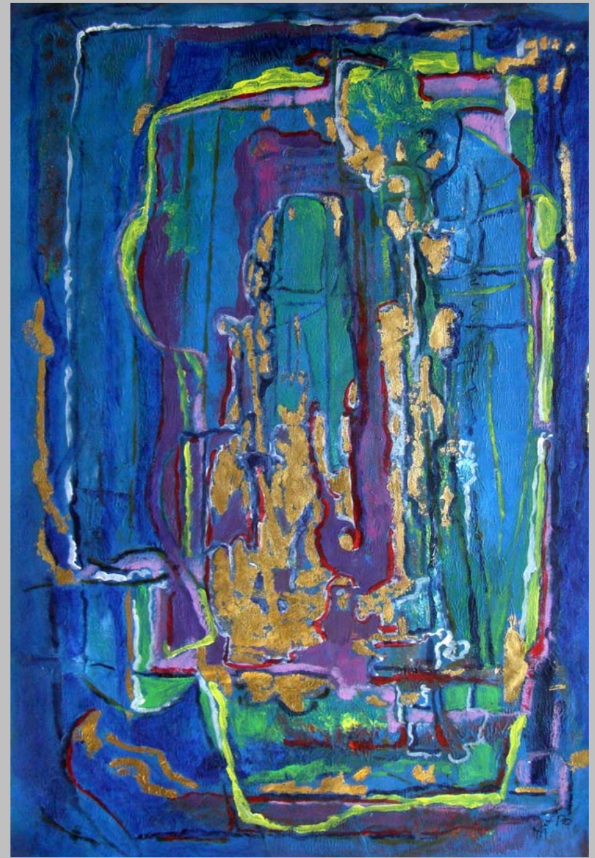
Transit 10, goldleaf acryl on paper, 60 x 40 cm, 2010