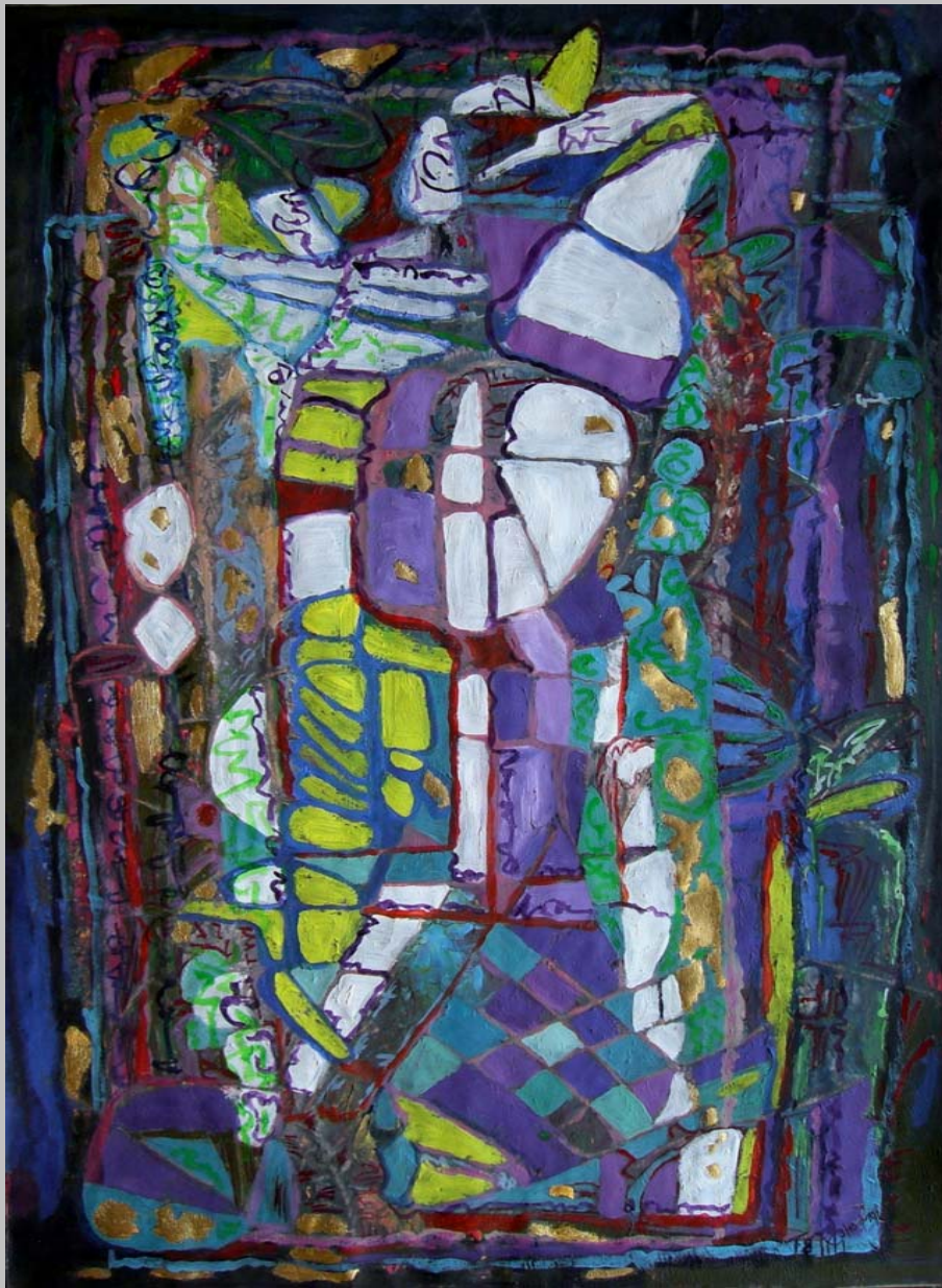
Transit 8, goldleaf gouache acryl on paper, 60 x 40 cm, 2010