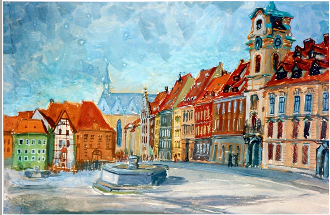
Marktplatz mit Stöckl in Eger, Gouachemalerei / Aquarell, 42 x 60 cm