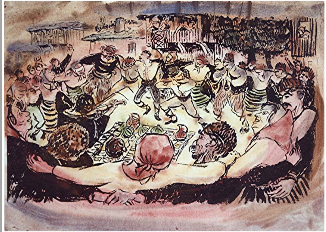
Links: Familienzusammenhalt über Generationen , Linolschnitt, 50 x 55 cm, 1970; rechts: Freudentanz , Illustration/Aquarell, 30 x 40 cm, 2008

Im Mittelpunkt seines Schaffens stehen der Mensch und hier ganz besonders die Kinder. Dies drückt sich auch in den Titeln seiner Arbeiten aus, so z.B. in seinem Zyklus „In den Kindern geben wir das Leben weiter“. Weitere Themen sind seine Heimat – die Landschaft um Eger „Teufelsturm an der Eger“ (Aquarell, 1966) – und die Familie „Großvater mit Enkelkind“ (Aquarell, 2008). Nicht nur die beschaulichen Momente des alltäglichen Lebens finden sich im Werk des Künstlers, zu Mensch und Zeit hat er eine klare Aussage, die dies in Titeln wie „Armut und Wohlstand“ oder „St. Sebastian an der Mauer“ (Berlin 1961) widerspiegeln. Sein umfangreiches Œuvre kann hier nur angerissen werden.