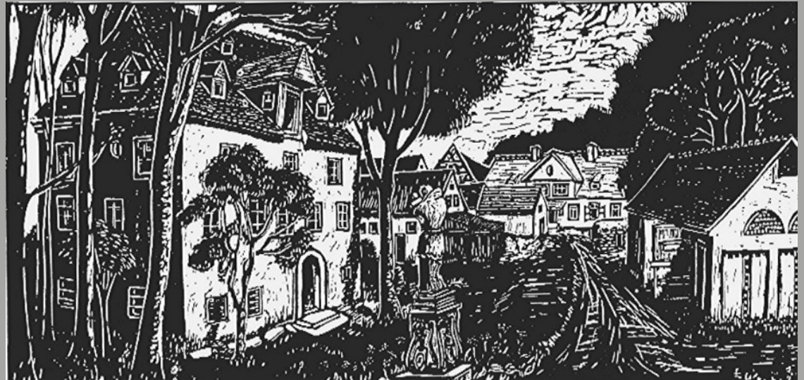
Oben: Schlossgut Lehenstein vor der Zerstörung 1950 , Linolschnitt, 42 x 60 cm, 1980; links: Haslau im Egerland , Linolschnitt