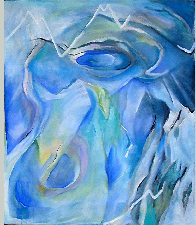
Oben: Wiesendiptychon , Öl auf Leinwand, je 115 x 100 cm; rechts: Berg , Öl auf Leinwand, 150 x 100 cm

bereits die gefährvolle Bedrängnis. Die geometrischen Formen könnte man auch als Sinnbilder der menschlichen „Vernunft“ und des technischen „Fortschritts“ sehen, die angesichts der Umweltzerstörung offensichtlich nicht viel mit Vernunft zu tun haben. Die Serie „Das rote Meer“ ist eine leidenschaftliche, expressiv-symbolische „Verbildlichung“ des ökologischen Zustands der Natur und auch ein malerisches Plädoyer an „unsere Vernunft“, „unsere Vernunft“ nicht nur zur Zerstörung der Natur zu verwenden.