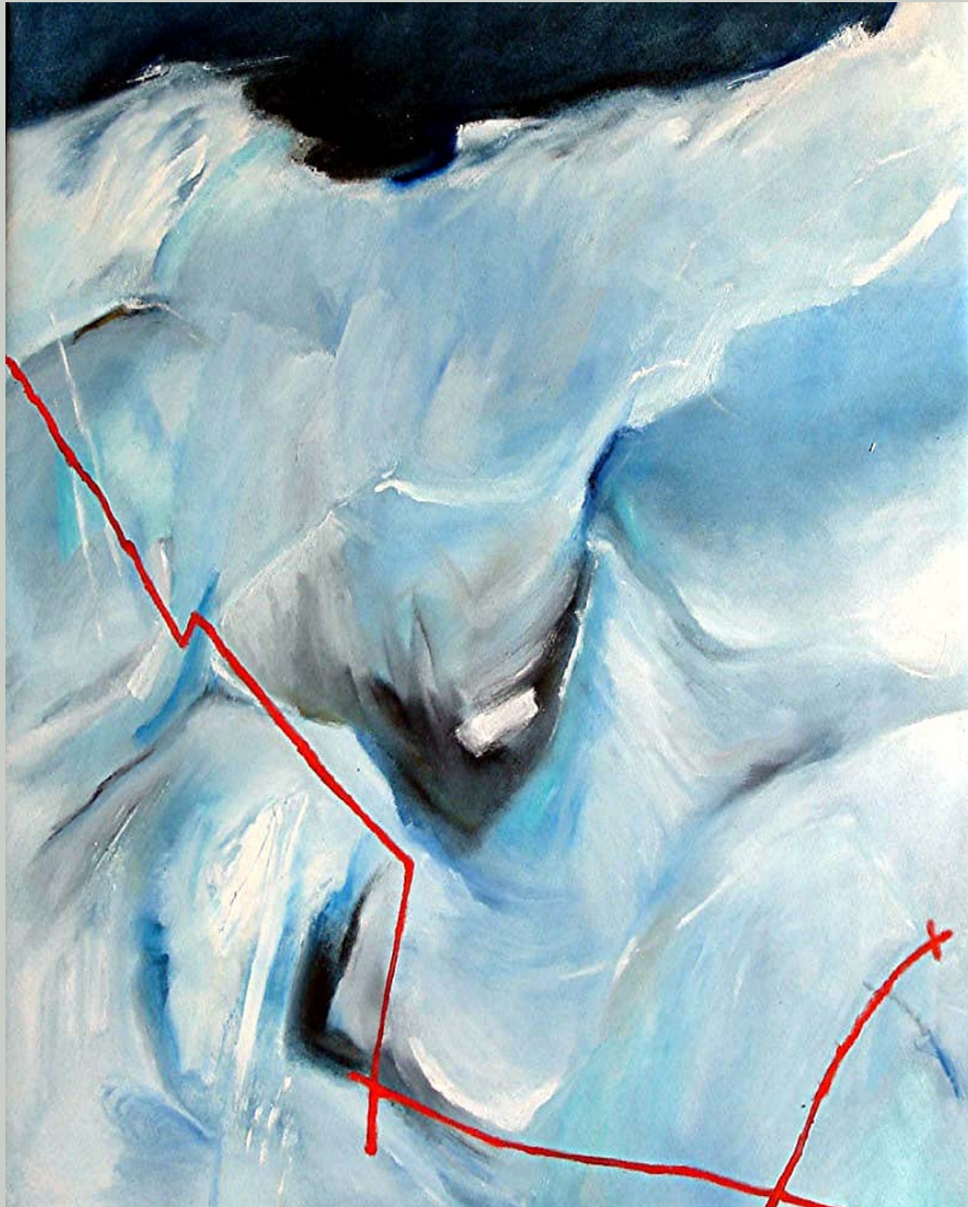
Gletscherbild 1 , Öl auf Leinwand, 145 x 125 cm