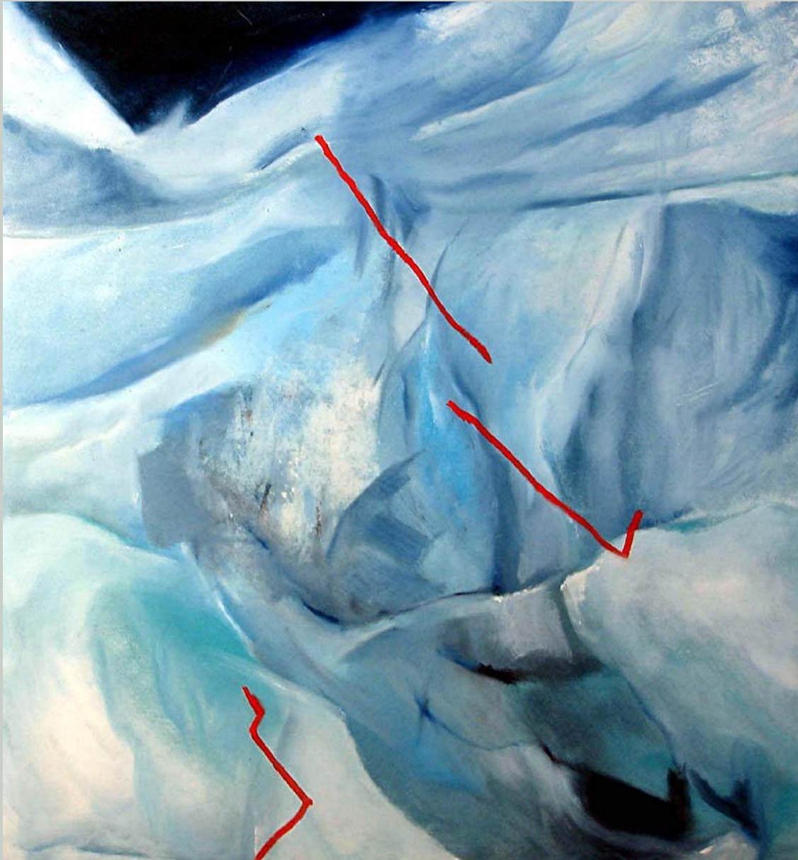
Gletscherbild 2 , Öl auf Leinwand, 145 x 125 cm