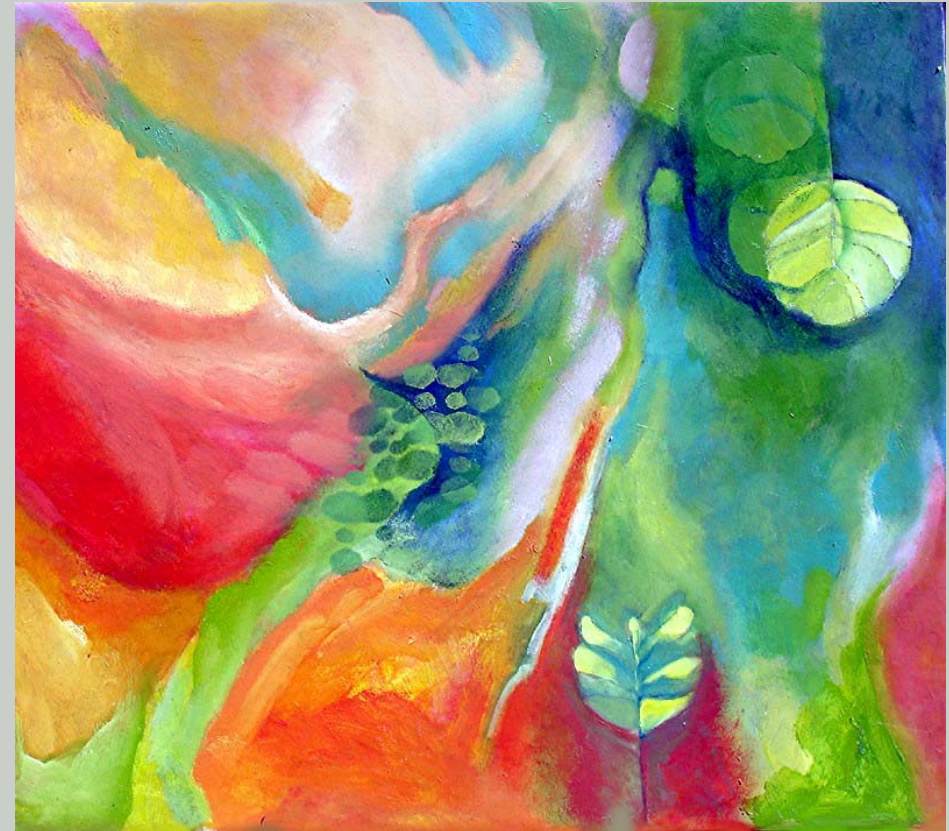
Zittergras , Öl auf Leinwand, 115 x 100 cm

in der expressiv-gestischen Malerei) sondern um einen emphatischen Nachvollzug der Bewegungsformen der Meereswellen. Im Grunde ist also die Darstellung eines roten Meeres (vor allem bei der Arbeit „VI“) eher mimetisch-abbildlich als abstrakt und die Expressivität des Farbauftrags von Rot und Weiß verdankt sich mehr dem Impuls der Nachahmung der Bewegung des fluiden Elements des Wassers.