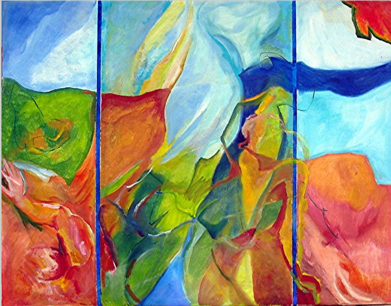
Erosion , Öl auf Leinwand, 145 x 200 cm