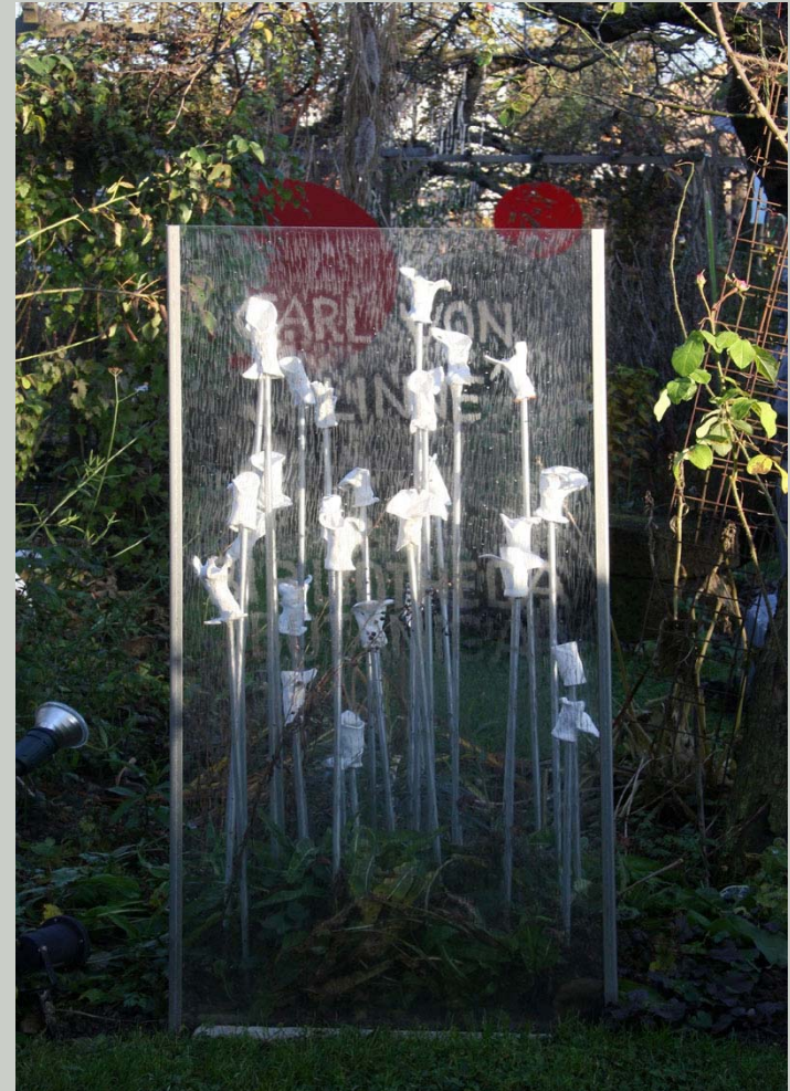
Grabmal für ausgestorbene Pflanzen, Installation Polyesterglas, Ytong, Keramik, Aluminium 175 x 75 cm